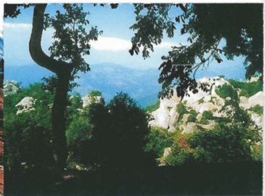
FORÊT DE L’OSPEDALE